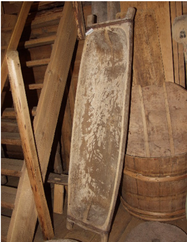
Taikinatiinu ja -kaukalo

Ennen leipomista jauhosäkki nostettiin lämpimään uunin viereen. Taikinatiinu ja muut tarvittavat välineet, kuten taikinakaukalo ja leipälaudat tuotiin aitasta ja harjattiin. Taikinatiinua ei milloinkaan pesty, ettei siitä kadonnut taikinanjuuri, joka takasi leipomisen onnistumisen.